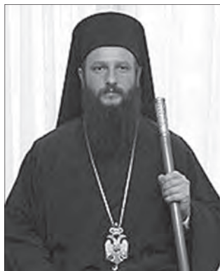
Архиепископ Охридский и митрополит Скопский ИОНАН (Вранишковский)